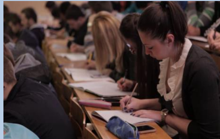
Савремени концепт наставе